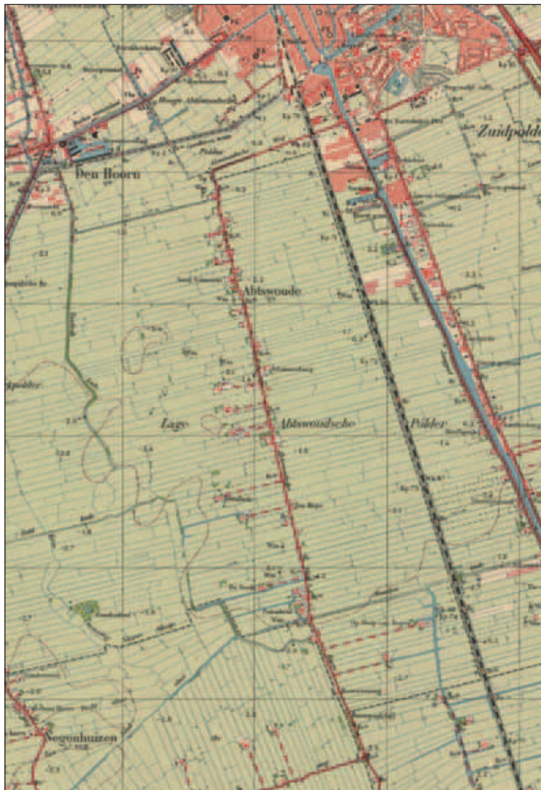
Fragment van de topografische kaart uit 1940.