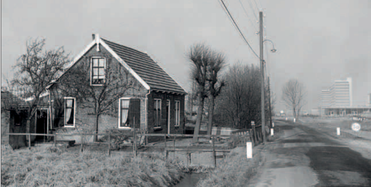
Abtswoudseweg 8, woning van de familie Bakker, uit ca. 1926.