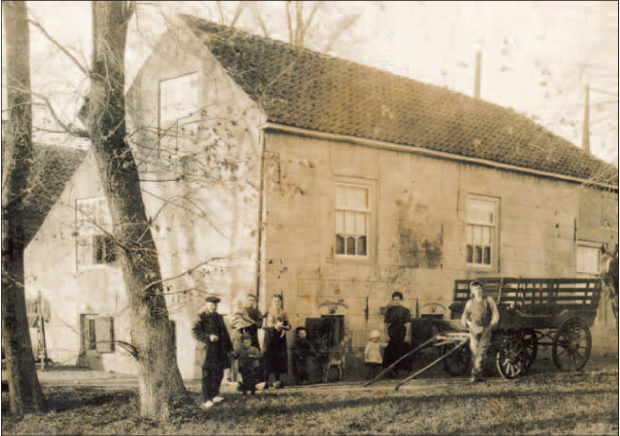
Abtswoudseweg 40, oude boerderij van de familie Moerman (gesloopt in 1927). Op de foto de familie Van den Berg die de boerderij pachtte.