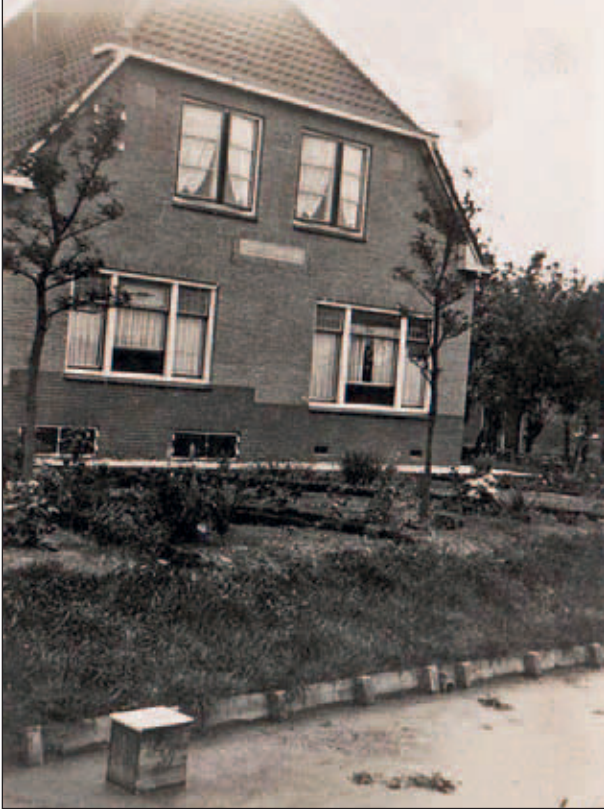
Boven: Abtswoudseweg 17, het woonhuis kort na de bouw.