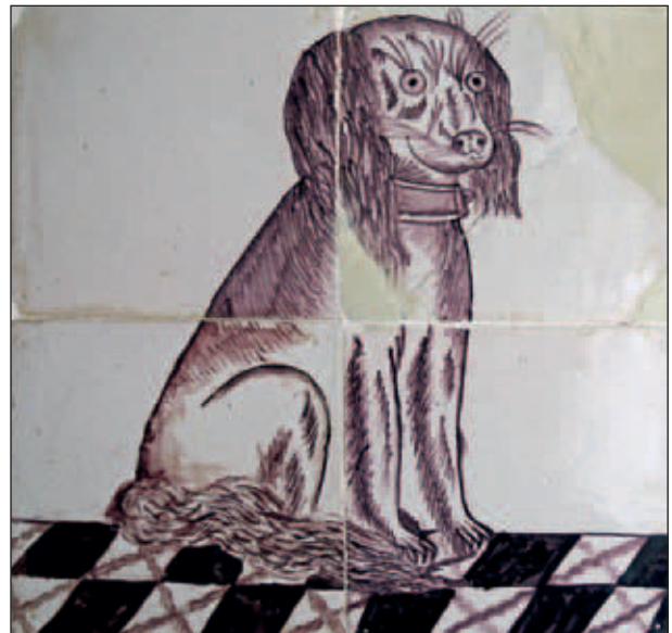
Abtswoudseweg 4, tegeltableau uit de oude boerderij.

Op de kaart van de Hoflanden is op deze plaats al een boerderij afgebeeld (ca. 1535). Deze stond in 1893 bekend onder de naam Schenkkanswoning 30 . De boerderij werd later aangeduid met de Bijbelse spreuk 'Door Gods Hand hoop ik Bestand'. Arie Hendriksz van der Drift