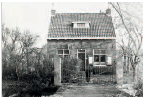
Abtswoudseweg 15, woning van de familie Zonneveld uit ca. 1925.