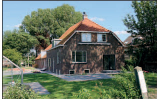
Abtswoudseweg 13, boerderij van Van Leeuwen.

De gemeente Delft had het voornemen van de boerderij van Van Leeuwen een buurthuis te maken. Maar om de trage besluitvorming van Delft te bespoedigen kraakten