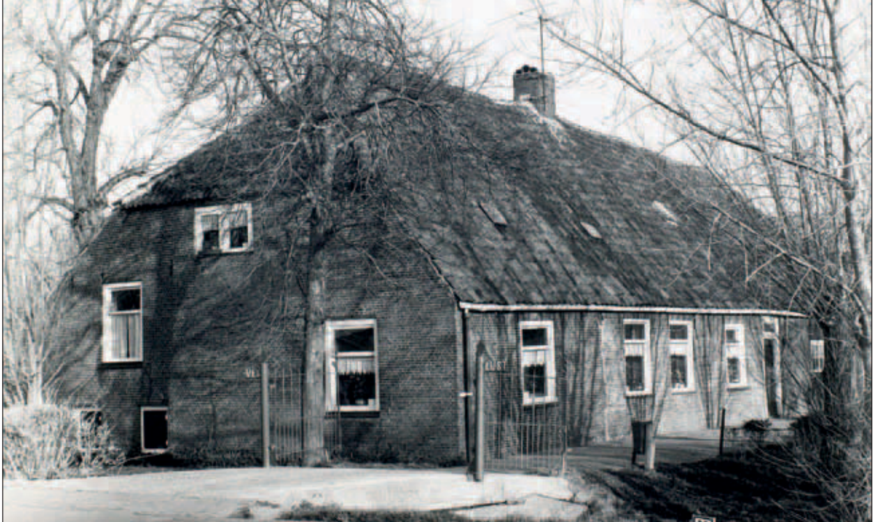
Abtswoudseweg 19, boerderij Veelust van de familie Van Leeuwen. Foto Ton Kerklaan 1983, Stadsarchief Delft.