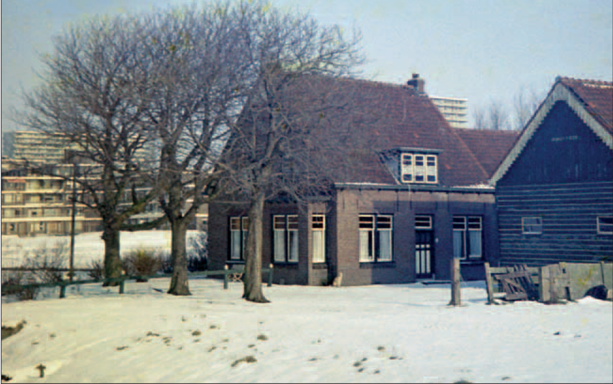
Abtswoudseweg 5, boerderij van Johannes van der Maarel.