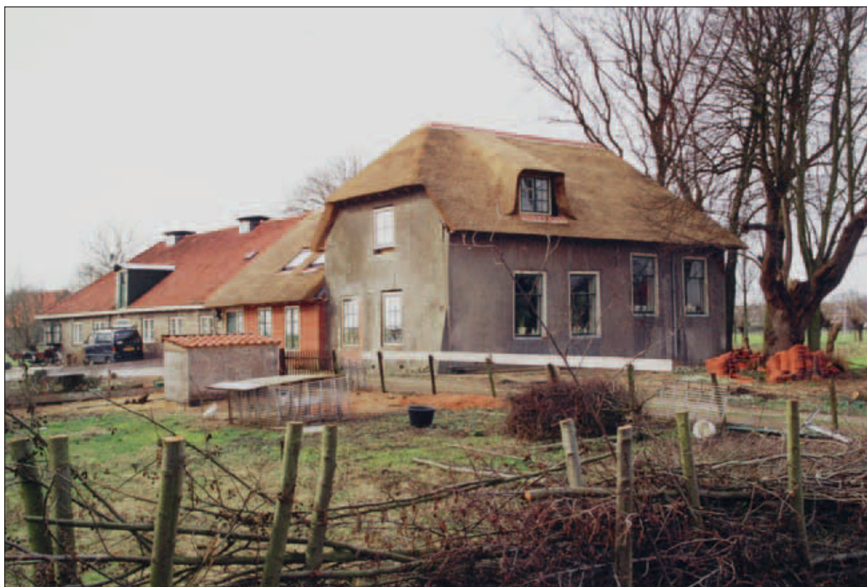
Abtswoudseweg 42, boerderij van de familie C. Kleijweg. Foto Kees Spiero 2001.