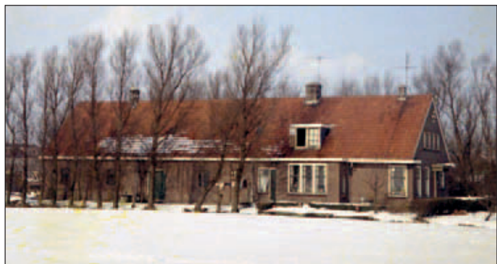
Abtswoudseweg 30, boerderij van het Burgerweeshuis, 's-Gravenhage waar de familie Hogendoorn woonde en werkte.

Het Burgerweeshuis voor Nederlands Hervormden te 's-Gravenhage bezat aan het begin van de twintigste eeuw in het Westland ruim 350 hectare land met hierop zeven boerderijen en vijf tuinderijen 47 . De opbrengsten hiervan werden besteed om wezen een goede opvoeding en een rooskleurige toekomst te geven. De 20 hectare in Abtswoude werden verpacht aan onder anderen: Roels, Hof-