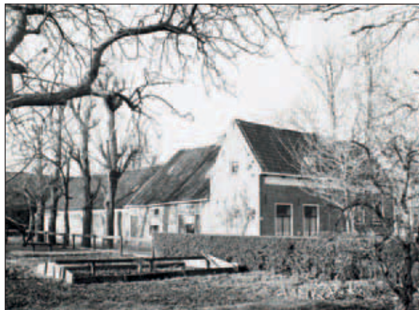
Abtswoudseweg 34, boerderij van de familie H. van Winden.

De boerderij van de familie Van Winden ligt nu midden in de woonwijk Tanthof. Hij kon worden teruggekocht van de gemeente Delft en is in de wijk nog de enige boerderij met zijn oorspronkelijke functie. De boerderijplaats gaat in ieder geval terug tot 1712 (Kruikius). De huidige boerderij werd gebouwd door Franciscus Beukers in 1873. Opmerkelijk is dat Adrianus Lansbergen uit Kethel, vader van Arnoldus Lansbergen (van nummer 32), korte tijd ei-