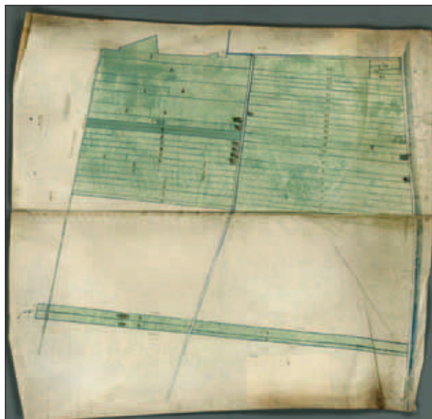
Blad 8 Papsou uit het Kaartboek van de Hoflanden, Maerten Cornelisz., ca. 1535

De achttien Kaarten van de Hoflanden onder Delft, gemaakt door Maerten Cornelisz. in ca. 1535 7 , behoren tot de oudst bekende kaarten van de Hof van Delft. Op de kaart van Papsou, blad 8, is de loop van de Papsouscheweg aangegeven. Vanuit de vronhoef (rechtsboven) liep de Abtswoudseweg eerst ongeveer een kilometer loodrecht op de Delftsche Schie en vervolgde na een haakse bocht zijn weg naar het zuiden over ongeveer vier kilometer tot aan de grens met Kethel, bij de Bonte Paal (grenspaal). De weg gaat hier verder als Harreweg. Ter oriëntatie: de boerderijlocatie ten oosten van de weg kwam overeen met Abtswoudseweg 1 met er schuin tegenover Abtswoudseweg 4. Op oude kaarten, zoals die van Kruikius uit 1712, wordt het korte deel van de weg naar de Schie Papsouse Laen genoemd en het naar het zuiden lopende deel Papsouse Wegh.