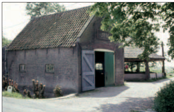
Abtswoudseweg 20, schuurtje naast de oprijlaan.