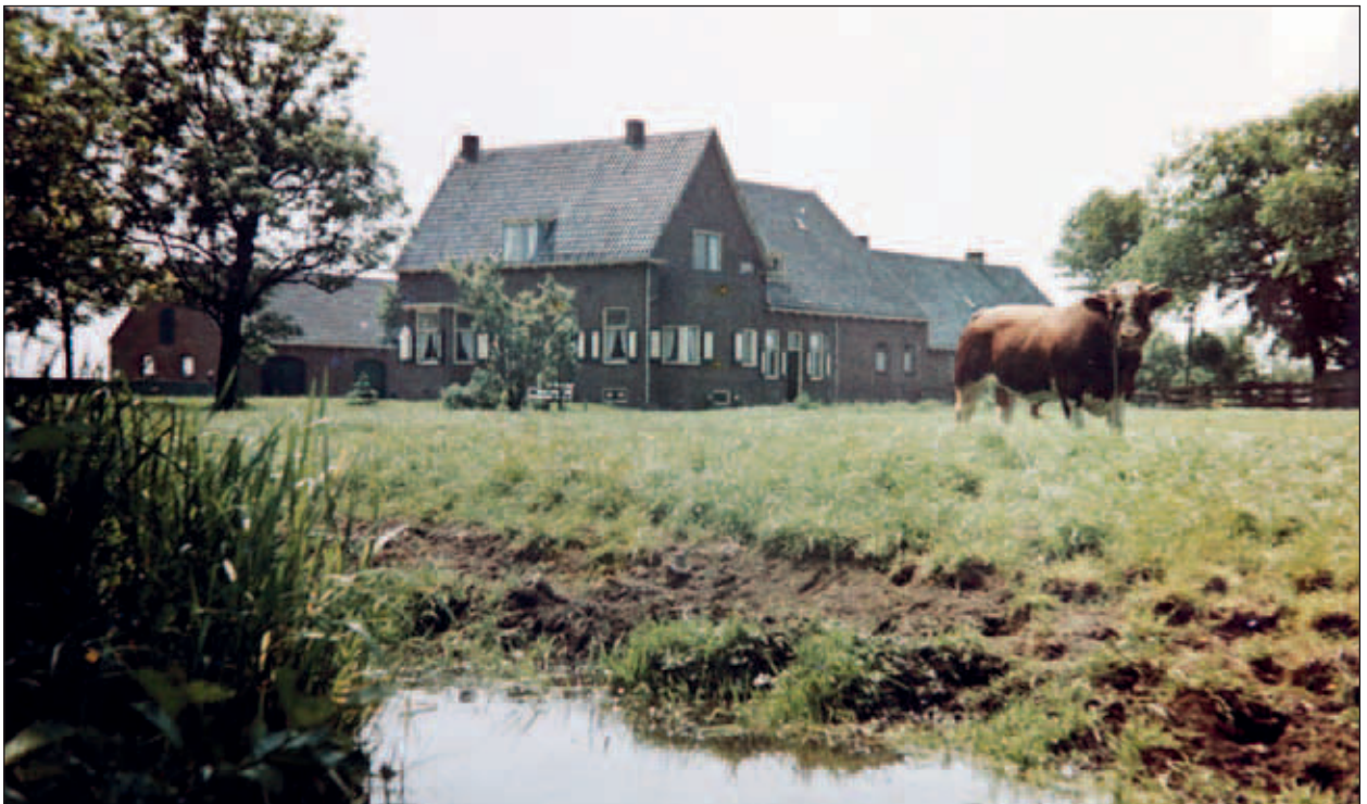
Onder: Abtswoudseweg 4, nieuwe boerderij van Paulus Graveland, en zijn stier.