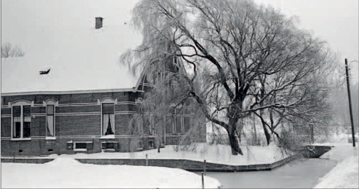
Abtswoudseweg 1, boerderij van Abraham Graveland.