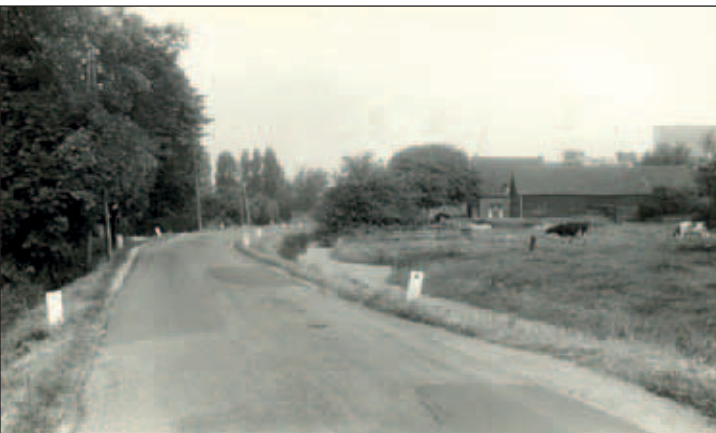
Abtswoudseweg 5 (rechts), en naderbij komende flats.