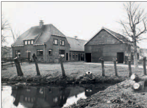
Abtswoudseweg 32, nieuwe boerderij van de familie Lansbergen.