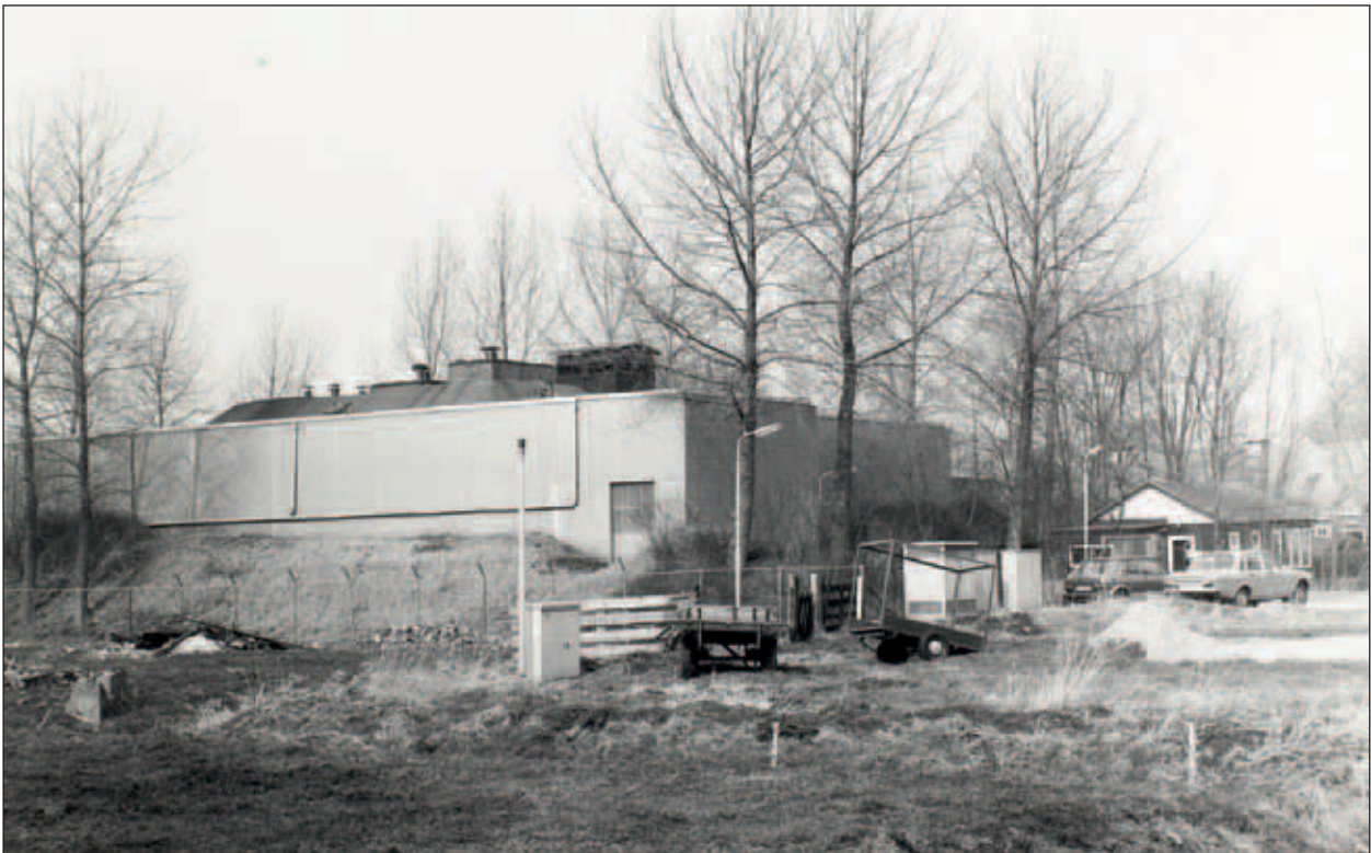
De bunker van Defensie.