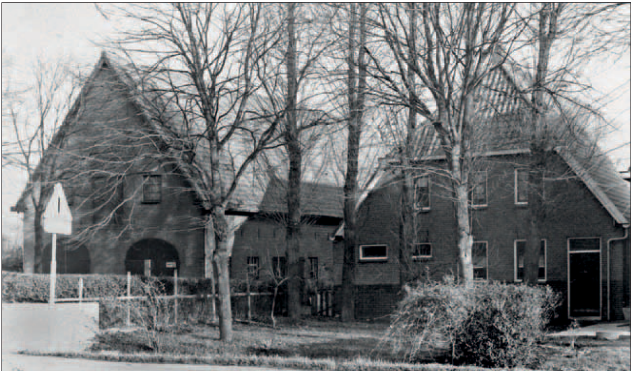
Onder: Abtswoudseweg 17, stal en schuur van boerderij Landlust van de familie Van Winden, 1983.