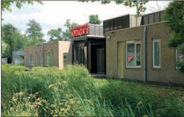
Gezondheidscentrum Tanthof op de plaats van de boerderij van Van Koppen.

ter, wellicht voor een betere prijs per hectare weiland. Twee jaar later werd Delft alsnog eigenaar. De boerderij werd gesloopt en ongeveer op deze plaats bevindt zich nu Gezondheidscentrum Tanthof aan de Veulenkamp.