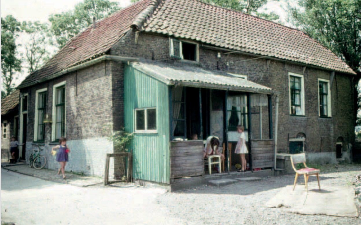
Abtswoudseweg 26, boerderij van de familie Van der Stap.