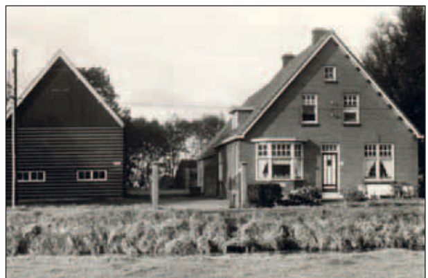
Abtswoudseweg 22, boerderij van de familie J. Romeyn.