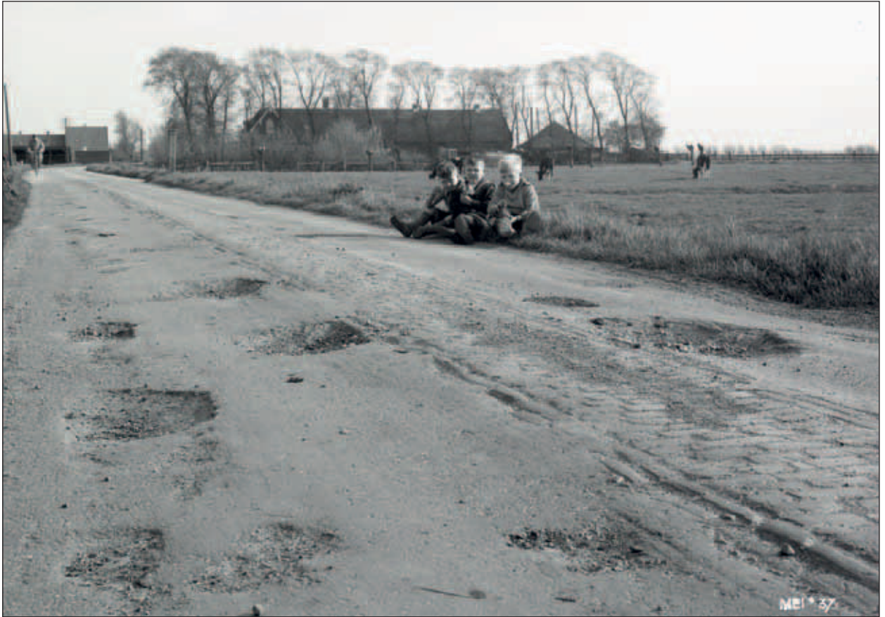
De Abtswoudseweg in 1937, net na de knik. Foto Stadsarchief Delft.