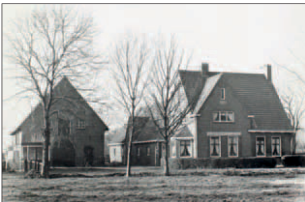
Abtswoudseweg 40, nieuwe boerderij van de familie Moerman. Foto Ton Kerklaan 1983, Stadsarchief Delft.