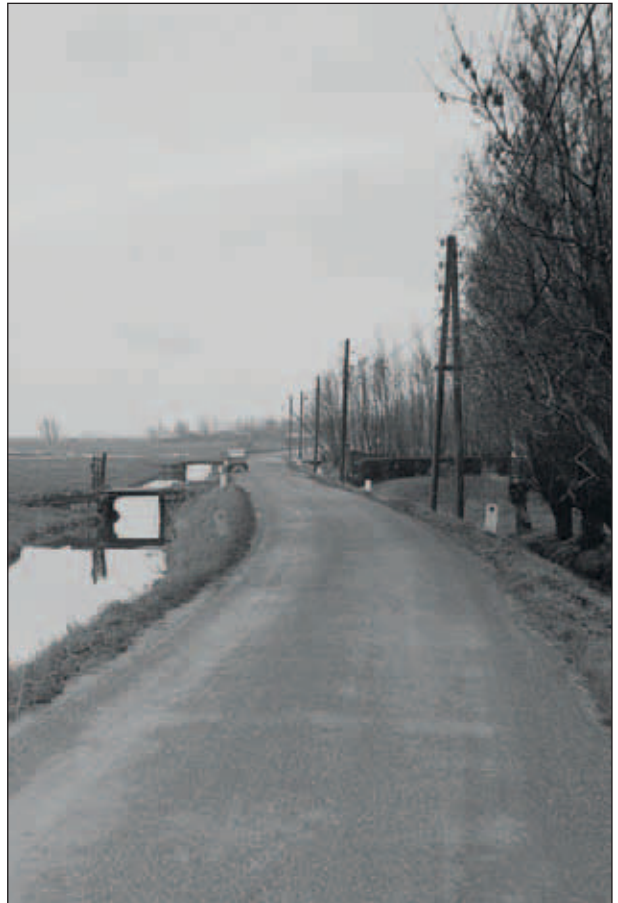
Abtswoudseweg 22, inrit van de boerderij is rechts bij de heg, foto Gustaaf van der Feijst, 1964, Stadsarchief Delft.