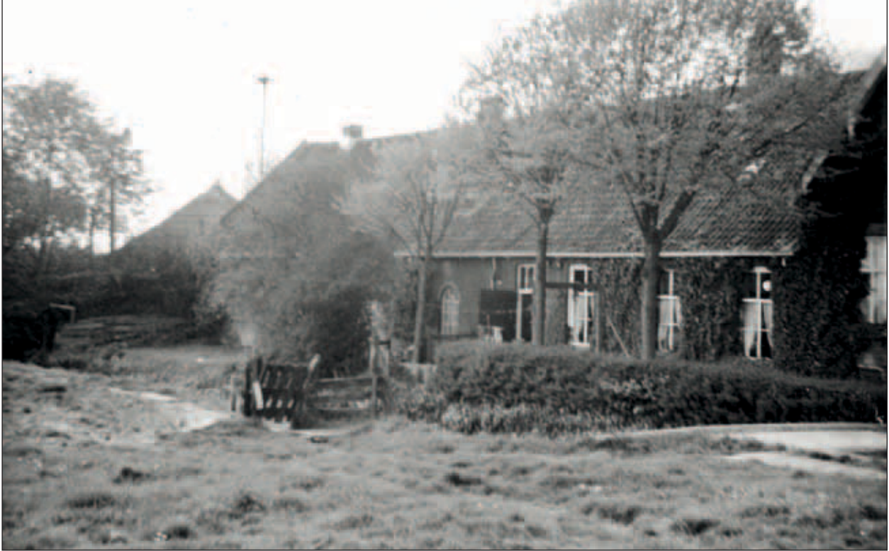
Abtswoudseweg 2 met links het klaphek en tegelpad van de Wennekerkade, april 1968.

Maarel. Hij zat enige tijd in de gemeenteraad van Schipluiden (na de oorlog) en hij heeft ervoor gezorgd dat de Abtswoudseweg straatverlichting kreeg. In juni 1968 is de boerderij afgebroken.