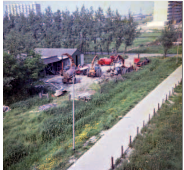
Het loonwerkbedrijf van Piet Graveland, Abtswoudseweg 2a.