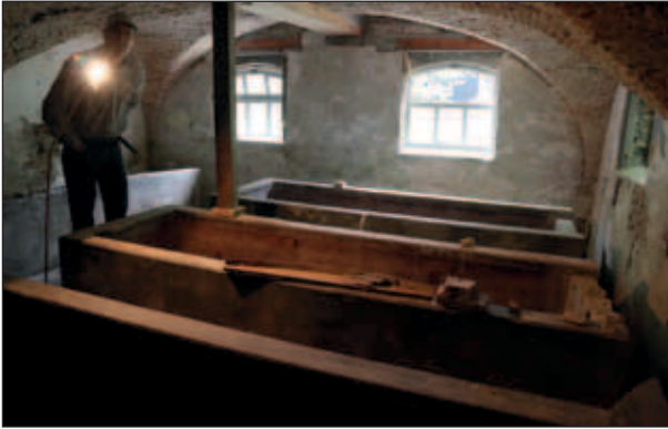
Abtswoudseweg 62, Deense bakken in de kelder met kruisgewelven.

vermoedelijk voor zijn zoon Cornelis de jongste; er waren twee zoons met de naam Cornelis. Jacob kocht ook de boerderij op Abtswoudseweg 64 voor schoonzoon Cornelis Kalisvaart, die was getrouwd met Jannetje van Schie. De Pootenheul bleef vervolgens vier generaties lang in de familie Van Schie. In 1989 werd het Bureau Beheer Landbouwgronden (BBL) korte tijd eigenaar van de boerderij. De grotere Holsteinkoeien pasten niet meer in de stal en de kosten werden te hoog gevonden om een nieuwe stal te bouwen. Cornelis van Schie besloot te verhuizen naar de Flevopolder en verkocht de boerderij aan het Bureau Beheer Landbouwgronden. Hiermee verloor de boerderij zijn agrarische functie. In 1994 werd de familie Vink-Van den Assem eigenaar van de boerderij en ging er ook wonen. In 2014 werd voortvarend begonnen met restauratiewerkzaamheden, die langzaam maar zeker vorderen.