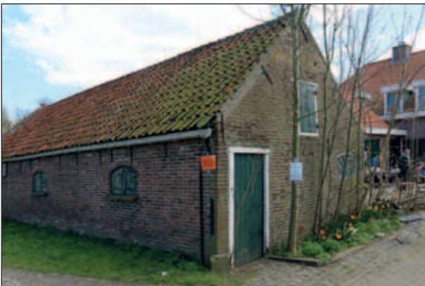
Abtswoudseweg 64, de in 1863 gebouwde woning langs de oprijlaan, 2015.