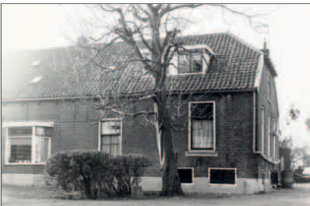
Abtswoudseweg 52, de boerderij in 1983.

verder. Deze gehele periode werd de grond gepacht. Na overlijden van Sjana werden haar bezittingen in 1982 onder Andries en Cornelis verdeeld.