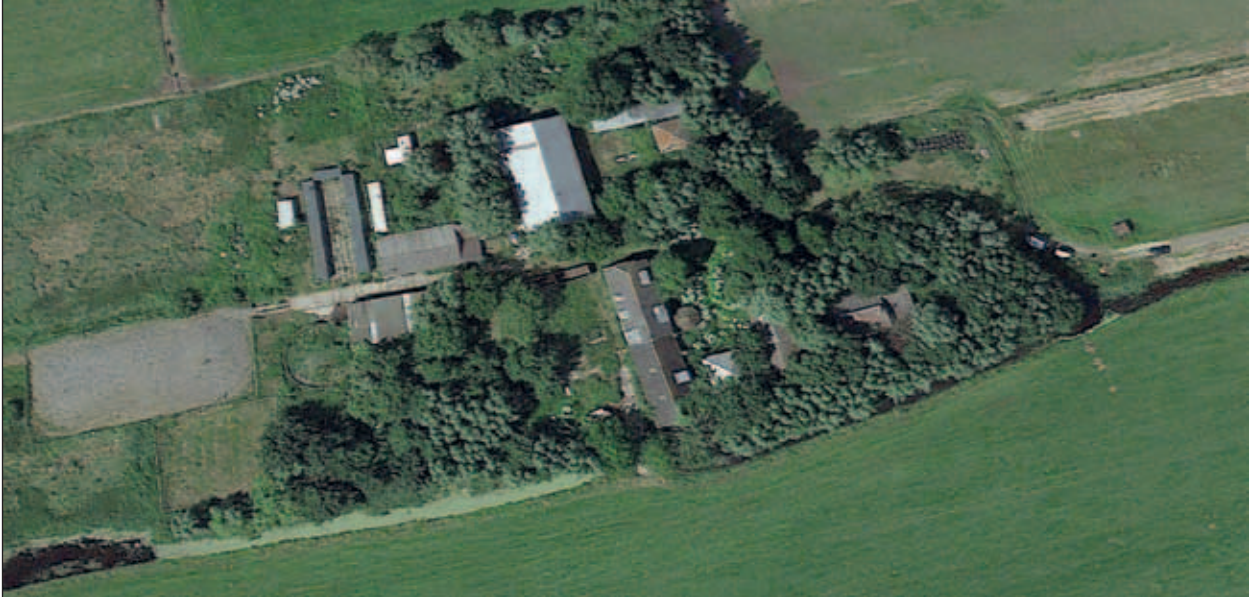
Abtswoudseweg 52, de boerderij en bijgebouwen vanuit de lucht.