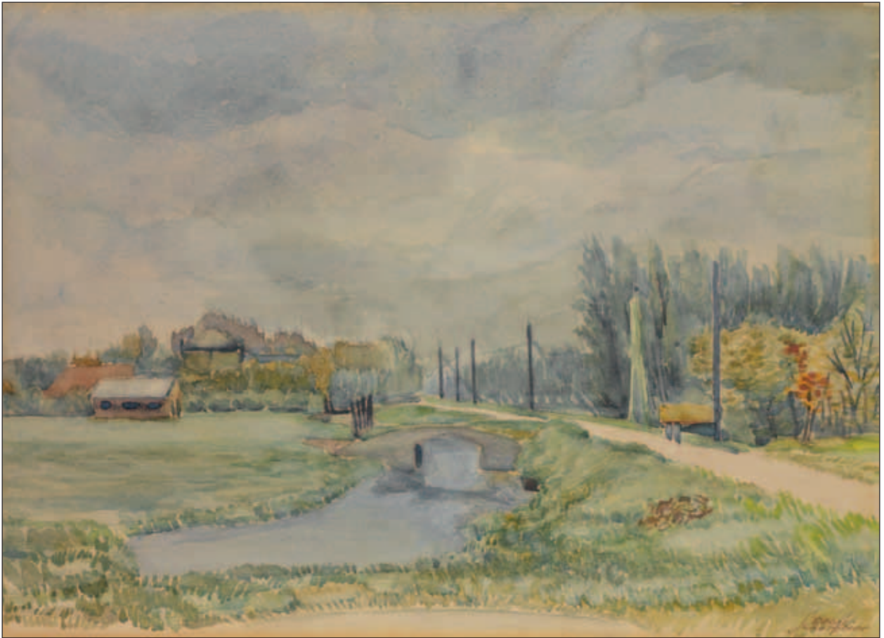
De Abtswoudseweg gezien vanaf de haakse bocht richting Kethel. Links de boerderij van Graveland, Abtswoudseweg 1. Aquarel Reggi Scherpbier, ca. 1960, Stadsarchief Delft.