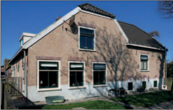
Abtswoudseweg 54, de fraaie woning van het melkveebedrijf van de familie Knijnenburg, 2015.