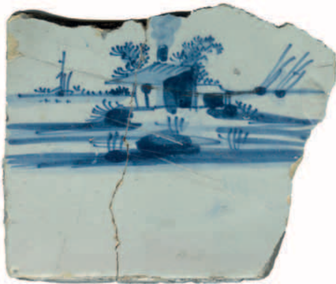
Delftsblauwe tegel gevonden nabij Abtswoudseweg 12, 14, 16. Collectie familie Ten Horn.

In de zomer van 1969 wandelde de familie Ten Horn-van Nispen een rondje vanuit hun nieuwe woning aan de Roland Holstlaan in Delft over de Abtswoudseweg (nu ongeveer het fietspad langs de Prinses Beatrixlaan). Op een berg bouwpuin van sloopwerkzaamheden van de boerderijen ter hoogte van nummers 12-14-16 vonden zij enkele fragmenten van een aardig Delftsblauw tegeltje, dat gedateerd werd op zeventiende of vroeg achttiende eeuw. Vermoedelijk is de tegel afkomstig uit de oudste boerderij van Van der Maarel op nummer 16. Hiermee is dit een van de weinige tastbare voorwerpen uit de agrarische periode van dit gebied.