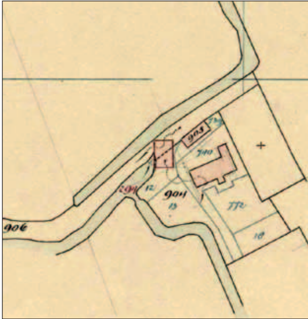
Abtswoudseweg 64, kadaster hulpkaart uit 1914 met de tweede woning uit 1863, aangeduid met perceelnummer 739 en 905. Perceel 906 is de oprijlaan die overgaat in de Tanthofkade.

kadaster, bijbouw plaats met een tweede 'huis' langs de oprijlaan. Of er veel gewoond werd, valt te betwijfelen, want met de typische stalramen met ventilatiesleuf en geen spoor van een schoorsteen zal het er niet snel behaaglijk zijn.