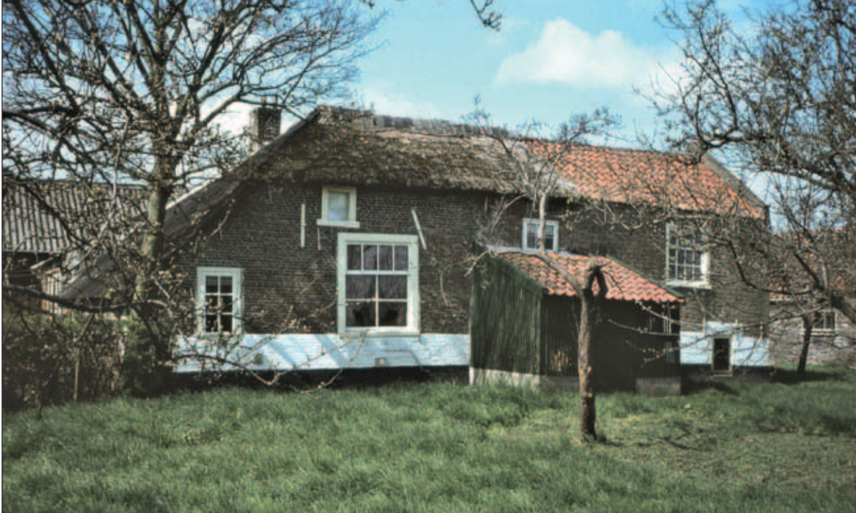
Abtswoudseweg 64, de boerderij aan de straatzijde met fruitboomgaard, 1982.