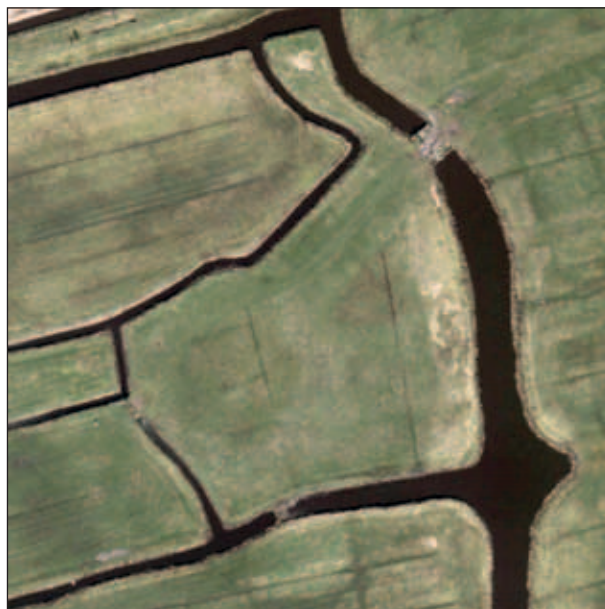
De verdwenen boerderijplaats in het huidige landschap. OSM/Leaflet/Esri.