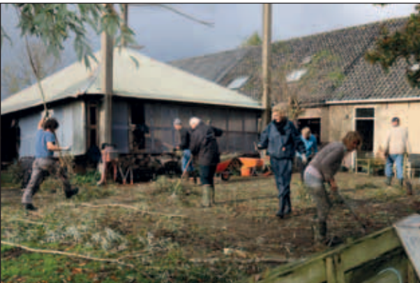
Abtswoudseweg 62, Werkgroep Wolf helpt regelmatig met het onderhoud van de knobomen, 2016.

Het sfeervolle erf, de oprijlaan met bomen, boomgaarden en hakhoutbosjes met tientallen oude bomen vragen veel onderhoud. Het is dan ook mooi dat Werkgroep Wolf hier jaarlijks komt helpen met snoeiwerkzaamheden.