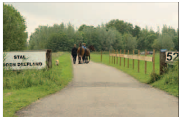
Abtswoudseweg 52, de toegang tot de Stal Midden-Delfland, 2005.